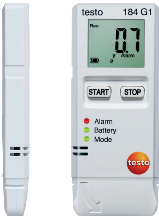
Illustration en taille réelle

Tous les avantages des enregistreurs de données testo 184 d'un seul coup d'œil.