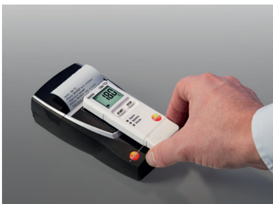
Impression mobile sur site